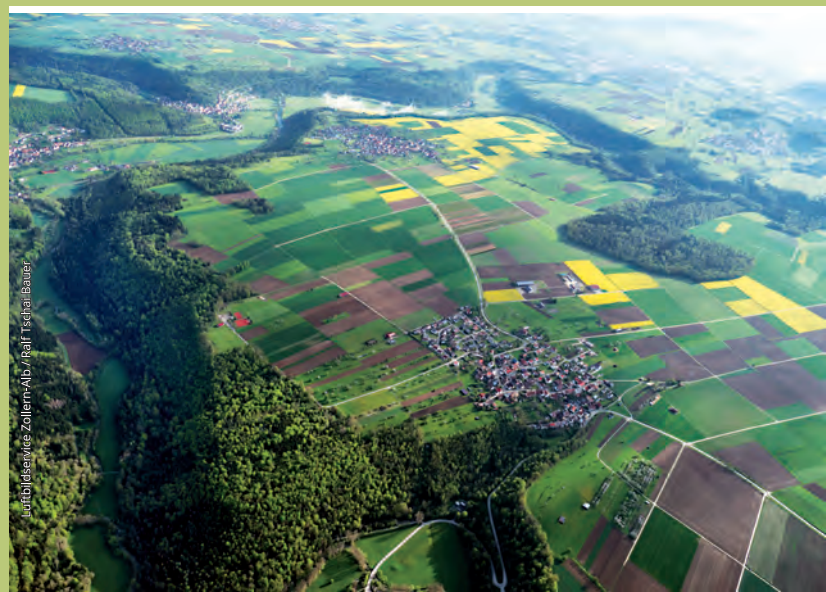
Atelier: Abc-Harrer, www.abc-harrer.de Aufblühschwärze: Zolten-Abt./Ralf Tschalibaauer

Hochmark Wanderwegenetz Schwalldorf / Frommenhausen