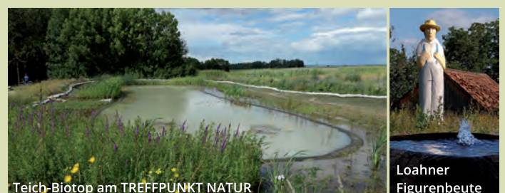
Teich-Biotop am TREFFPUNKT NATUR