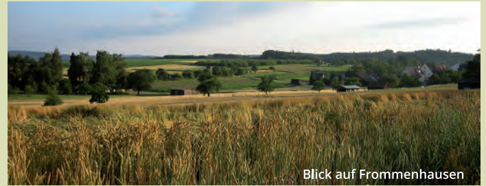
Blick auf Frommenhausen

Vom TREFFPUNKT NATUR Frommenhausen mit Bienenhotel, Weidenhaus, Arboretum und Teich-Biotop geht es über die Felder in Richtung Elbenlochwald. Am Südrand des Waldes öffnet sich das Panorama malerisch über die im Jahr 1289 erstmals erwähnte, aber bald danach „abgegangene“, das heißt, aufgegebene mittelalterliche Siedlung Bossenhausen hinweg hoch hinauf zu Rammert und Albtrauf mit der Burg Hohenzollern am Horizont. Vom „Weißen Kreuz“ führt die Route vorbei an einem Wegkreuz mit einem Kastanienbaum durch Frommenhausen an Pilgerherberge, Rathaus, Kirche und Schloss entlang zurück zum Ausgangspunkt.